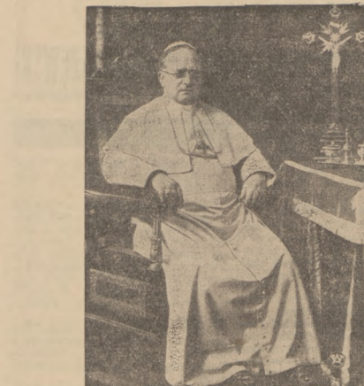
ZMARŁY OJCIEC #W, PIUS XI

Głęboka żałoba okrywa cały świat katolicki zgon Namiestnika Chrystusowego, papieża Piusa XI. Jakżeż żal, jaki smutek budzi w Polsce!