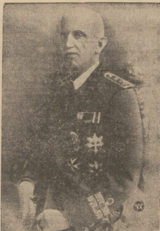
J. K. M. król Itali i Cesarz Etiopii Wiktor Emauiel III