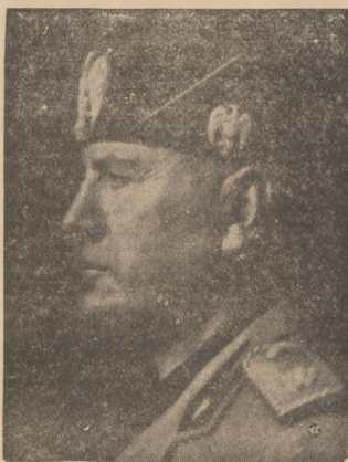
Szef rządu włoskiego i twórca faszystowskiej Italii — Benito Mussolini

Morze Śródziemne, kolebka cywilizacji, teatr największych wydarzeń w dziejach ludzkości, po wieświekowal cieży w naszym położeniu — wzbudziło się. Powraca ono do roli kręgu, na którego wodach — po spłotu z dziejącym zatargiem, nabrzmiewającym na Pacyfiku — rozstrzygać się będą drogi: rozwoju wojennej cywilizacji. Odrodzona Italia sięga na tym morzu po prymat, spotykając się z zwyciężym oporem dotychczasowych gospodarzy: A. Polaka, która hołmami wspania „kulturalnymi” także była związana z basenem Morza Śródziemnego, która kręgiem swoich zainteresowań polityczno - gospodarczych schodziła na Bałkany i aż do Palestyny, nie może zachodzącym tam przez manom przypatrywać się obójnie.