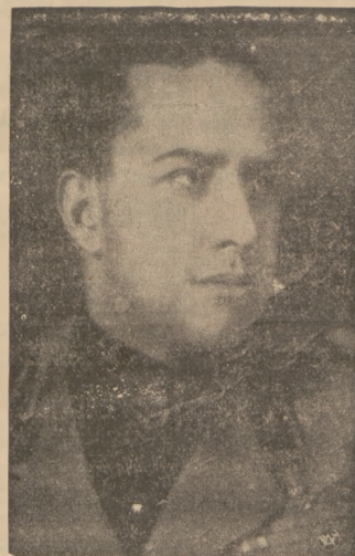
Minister spr. zagr. Itali hr. Galeazzo Ciano, który przybywa jutro do Polski.

wysuniętego punktu wybrzeża Afryki, przysiadła Bon. Przecież ja tym har- dozie, że między Sycylią a przysiadłm Bon położona mała, skałista wyspa