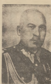
Nowy komendant straży granicznej

Nowy komendant straży granicznej pan. brygady Włodzisław Czerny, mianowany na stanowisko komendanta głównym Straży Granicznej.