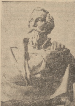
Dziś, w pięćdziesiątą rocznicę śmierci w Warszawie pomnik plk. Nullo.