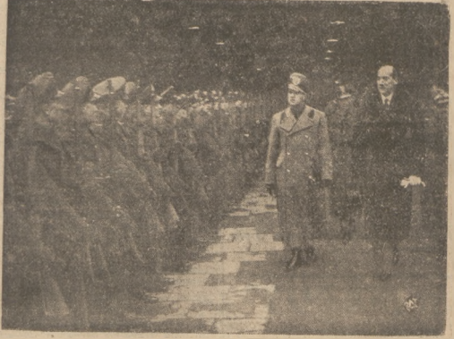
Min. Ciano w towarzystwie min. Becka przed frontem kompani honorowej

WARSZAWA, 26.2. PAT. O godz. 13 P. Prezydent Rzeczypospolitej prof. I. Mościcki, przyjął na Zamku Królewskim na audiencji ministra spraw zagranicznych Włoch hr. Ciano.