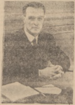
Minister spraw zagranicznych Rumunii p. Gafencu przybywa wraz z małżonką do Warszawy w sobotę z oficjalnej wizyty.