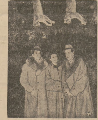
Min. Ciano, hr. Edda Ciano i m. Beck podczas oglądania w Warszawie. W górze widoczny król. Kół widać upiorną łaz.