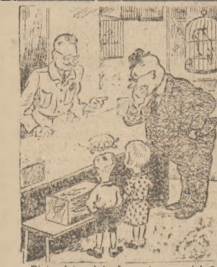
— Pamiętajcie słoty! — to za wiele! Altem sobie może być przecież sto pięćdziesiąt lat. — bożnie pan miał długo z niego przyjemność.