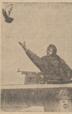
GOLEBIE POCTOWE NA USLUGACH LOTNICTWA BRITYSKIEGO

Byryjskie lotnictwo wojenne postanowiło wykorzystać gołębie pocztowe dla przyspieszenia pilnych meldunków w powietrzu. Do nas pierwszy polubił w tym nowym kierunku w czasie ostatnich manewrów lotniczych w Calais. Na zdjęciu lotnik brytyjski wypuszcza w powietrze gołbia pocztowego z meldunkiem informacyjnym.