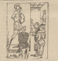
— I to ma być zwycięzca? Hm, chciałbym zobaczyć zwycięzconego.