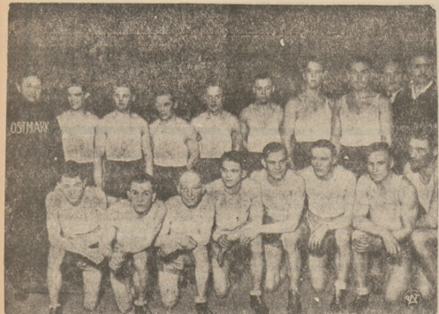
NA RINGU BOKSERSKIM

W Katowicach odbył się mecz bokserki między reprezentacją Śląska i Wiednia, zakończony zwycięstwem drużyny śląskiej w stosunku 11:5. Na zdjęciu obie drużyny.