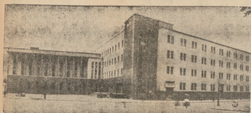
DOM ŻOŁNIERZA POLSKIEGO W POZNAŃIU Dom Żołnierza Polskiego w Poznaniu, wzniesiony z okazji społeczeństwa Wielkopolskiego. Urzeczywistnienie Długo odbędzie się w dniu 10 marca.