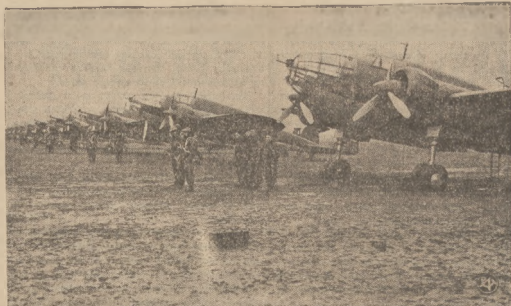
Kadecja bombowców polskich typu „Lublin”

Lądowanie samolotów w Warszawie nastąpi równocześnie na lotnisku Mołotowski.