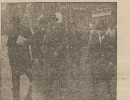
MINISTER BECK W KATOWICACH

Dawna bowiem nazwa „Deutschland” wydasz mi się za krótką i niewielką m. Zmieniał ją przeto na: „Deutsch-Heim-und-Hausdeutschbeheim miltarwosmeland”.