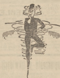
— Gdybym wiedział, jak teraz przesiadł.

— Mam wrażenie, że wiem już nieco o tej organizacji. To wywiad japoński nieuniknie rozciąga się od New Yorku do San Francisco i od Kanalu Panamskiego do granicy kanadyjskiej.