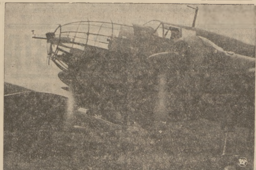
SILNI, ZWARCI, GOTOWI!