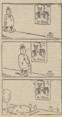
Skuteczny plakat hypnotyza