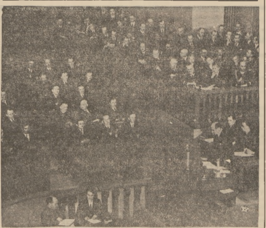
Salą Sejmą z widokiem na ławy rządowe, w chwili przemówienia ministra Becka