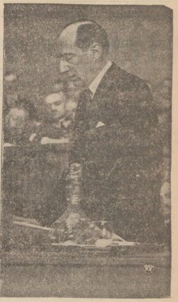
Min. Beck na trajbony.

kuracyj jest normowania czynności wtroby i nerek. Dwaślestwie doświadczenie wy- kuzko, że w chorobach na tle zlej przemiany materii, przetrzymanego zaparcia, objętości, ła- mienich żółciowych, łótkcie, artretyz- mien mają zastosowania zioła lecznicze „CHOLEKINAZA” H. NIEMCOWSKIEGO, Biurozy hospitalne wiewy, laboratorjum Fizjolog cno i chemiczne „CHOLEKINAZA” H. NIEMCOWSKIEGO, Warszawa, Nowy Świat 5 oraz apteki i składy apteczne. 1929