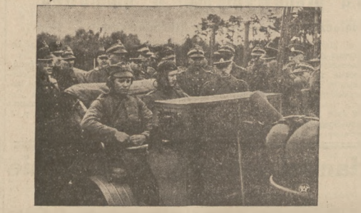
Naczelny dowódca wojsk niemieckich w czasie swego pobytu w centrum wysokości, piechoty w Rembertowie był obecny na świętym bożym, poległym z ostrym strzałem w płuchoy i artylerji; Na zdjęciu gen. Rasztkei w towarzystwie ministra gen. Kasprzyckiego i grupa generałów, przy polowej stacji radiowej.

W lecie 1968 r. urządził Komitet kolonie wypoczynkowe dla 424 dzieci w wieku szkolnym w Okracimowie, oraz finansował podjętą kolonię dla dzieci żydowskich w Krzykawce. Oprócz tego urządził Komitet podwieczorniki w domu dla 846 dzieci w dzielnicy wznaw