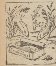
Obciążenie się przekroczone jak to wyglądać będzie w pudełku!