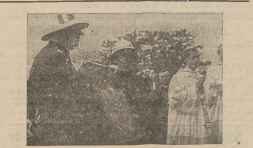
RYNGRAF OD STRAŻACTWA POLSKIEGO DLA KAPLICY MATKI BOSKIEJ CZĘST.