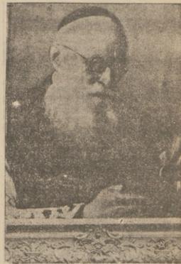
AP. J.E. KS. ARCYBISKUP ROPP Dnia 25 lipca zmarł w Poznaniu, o czym donosiłimy wczoraj, JE. ks. arcybiskup metropolita nabyliwski Edward Ropp. Na zdjęciu: portret ep. ks. arcybiskupa metropolity Roppa

Wolałoby nie powtarzać szczegółowego opisu trudności, które posiadają charakter techniczny, mimo zdaniem udawanego tych szczegółów ze strony niemieckiej publicystów i sztabowym z tego rodzaju sprawami związane są skomplikowane zagadnienia”.