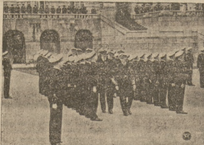
REGAL JERZY VI NA INSPEKCJI W MORSKIEJ SZKOLE KADETÓW. Podczas pobytu przy królewskiej w Darzin w królu Jerzy VI dokonał inspekcji w szkole marynarki wojennej. Na zdjęciu w królu w czasie przeglądu kadetów na podwórku szkolnym.