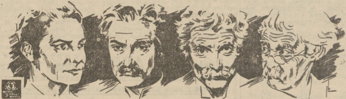
Robert Donat jako Mr. Chips w różnych fazach jego życia.