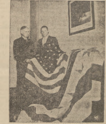
STANDARDY STANÓW UNI AMERYKAŃSKIEJ DLA P. PREZYDENTA R. P.