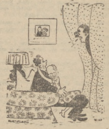
— Nigdy nie ma opuszczać moją najdroższą, to znaczy (widnie okna) — bierz paszprzepraszam, nie wyjdźcie.

IDEALNY wypocznik w ładnym otoczeniu w Sosnowcu, las, piasek, woda, na sierpień po 3 zł dziennie. Władimir w Admistracji.