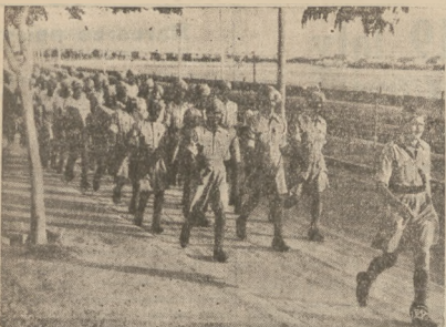
ANGLIA ZWIĘKSZA SWOJE GARNIZONY NA GRANICACH LIBII

Na zdjęciu oddziały brytyjskich wojsk kolonialnych z Tadi po przybyciu do Egiptu nad kanaem Suezkim udają się do garnizonów brytyjskich celem wzmocnienia załóg. Jak wiadomo, garnizony włoskie na granicy libijskiej zostały już dawniej wzmocnione.