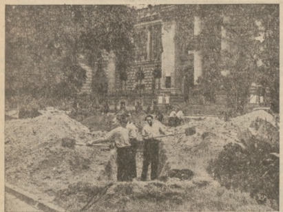
ZARZĄDZENIA OCHRONNE STOLICY

W dniu 25 bm. prezydent m. st. w Warszawie wydał do ludności stolicy odezwę wywołującą wszystkich obywateli, woliących od pracy, niezbędnej w obecnej chwili, aby dobrowolnie zgłosili się do kopania i rowów celem przygotowania stolicy na wypadek gwałtownego ataku. Wstrząsana stolicy zagrożona. W związku z tym rozpoczęto już pracę nad kopaniem rowów przeciwpożarowych, które muszą być szybko zakończone. Na zdjęciu fragment kopania rowów na jednym ze skwerów stolicy.