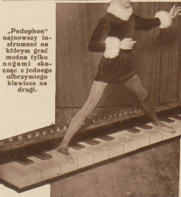
„Pedophon” najnowszy instrument na którym grać można tylko skacząc z jednego olbrzymiego klawisza na drugi.