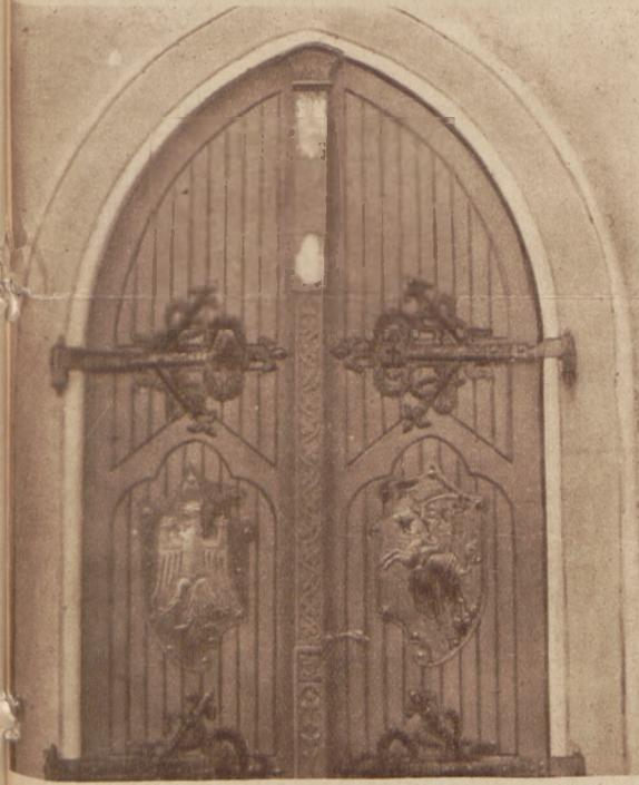
Artystycznie wykonane drzwi w kościele ol- kuskim ze stylizowanym okuciem wykonanem w roku 1916, przez zakład ślusarski J. Jarno w Olkuszu.