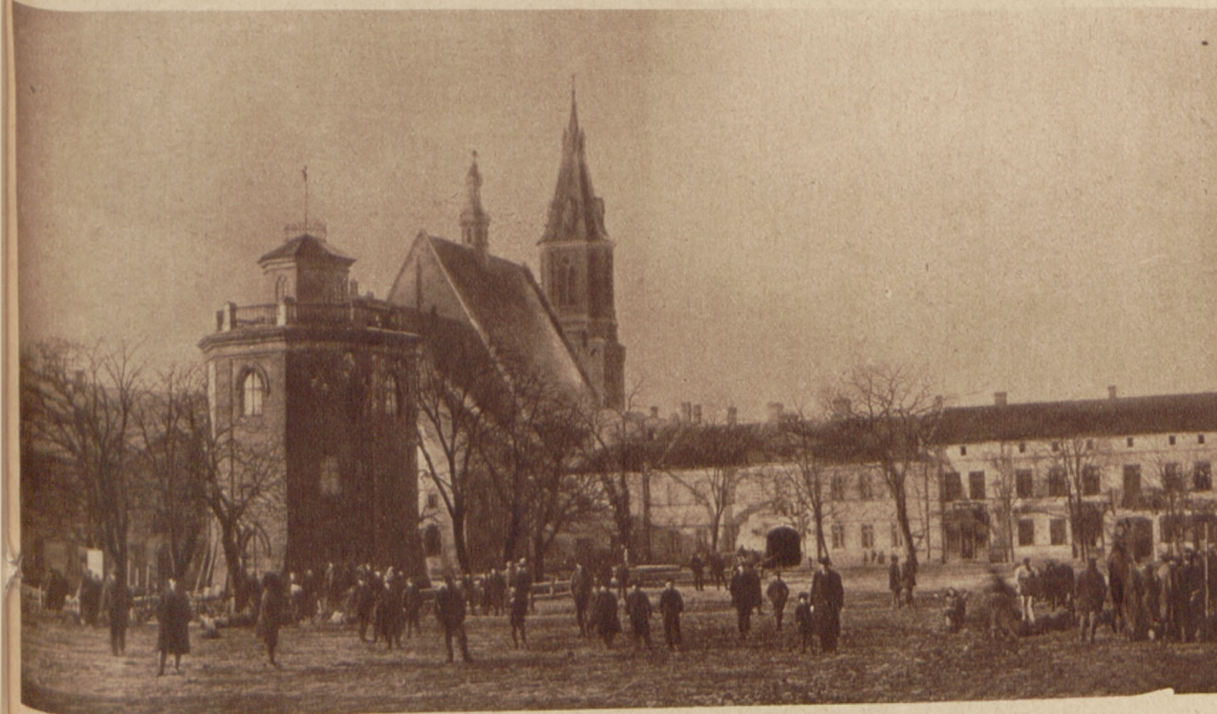
Rynek w Olkuszu.