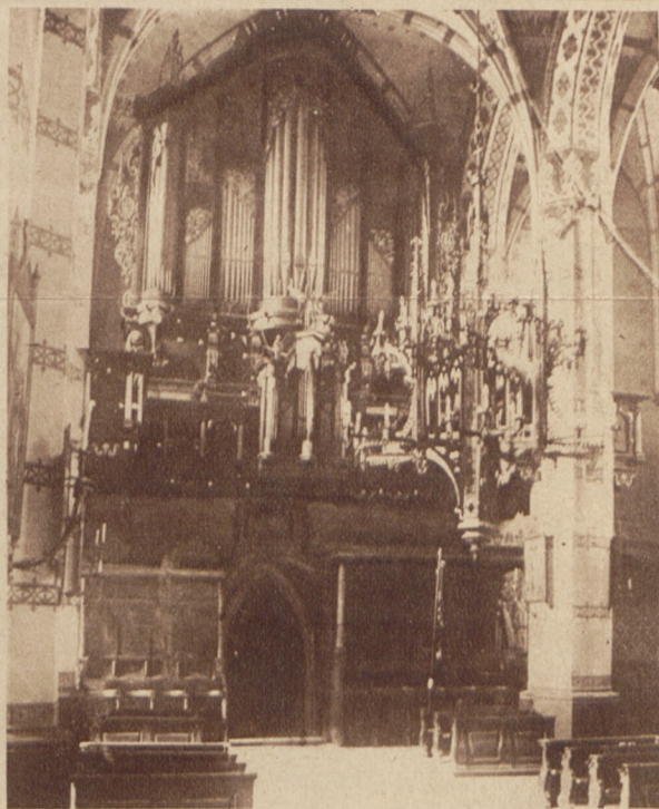
Organy w kościele olkuskim, ufundowane u schył- ku 16-go wieku przez królową Annę Jagiellonkę.