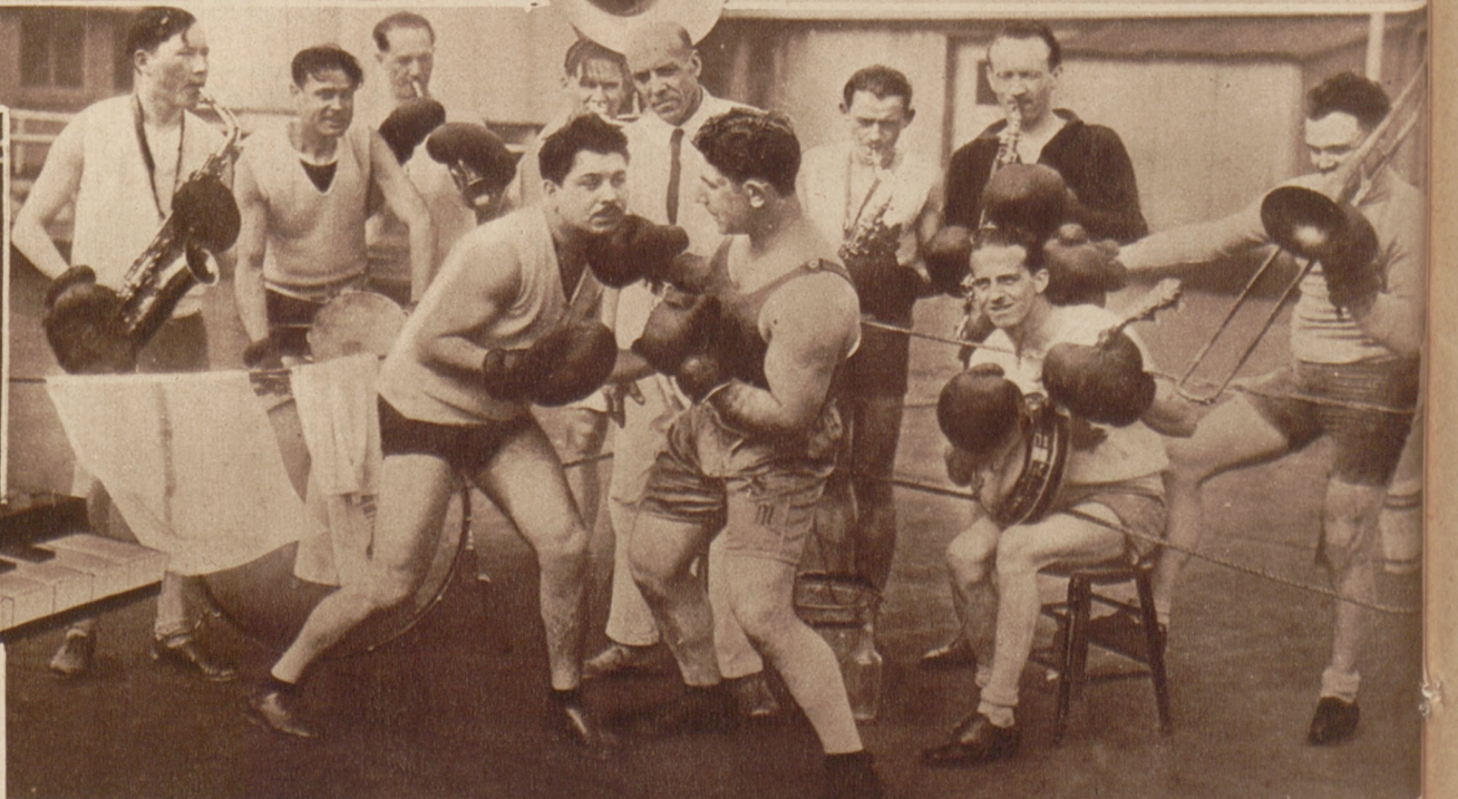
Pomysłowi Amerykanie uważają, że uderzenia walczących bokserów znakomicie wzbogacają dźwiękowo orkiestrę jazzbandu. Nil admirari.