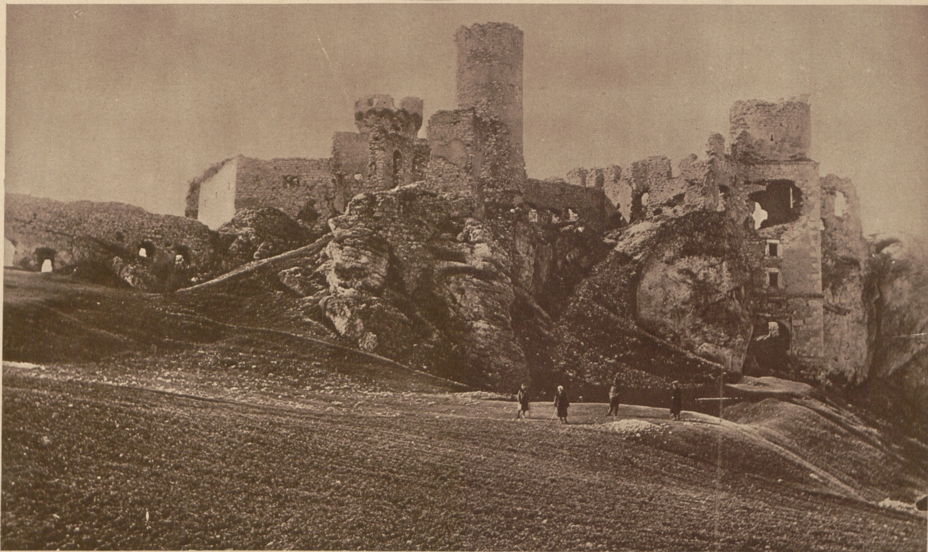
Ruiny zamku w Ogrodzieńcu, dla zachowania których zawiązało się w Zawierciu Koło opieki.