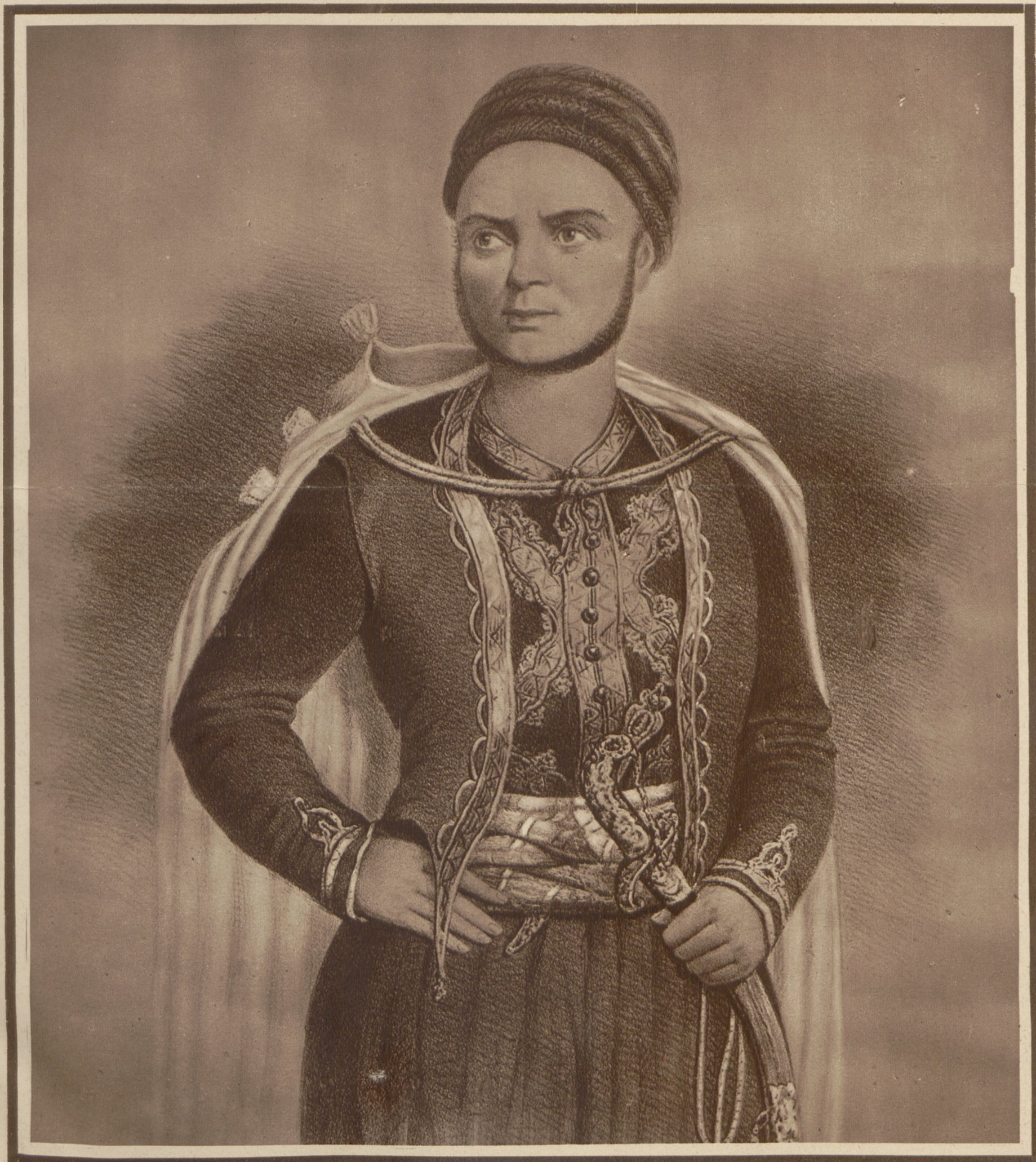
Józef Bem, znakomity generał polski, ur. w r. 1795 w Tarnowie, zmarł w Aleppo w Turcji w r. 1850 jako Amurat Pasza. Zwłoki jego sprowadzone będą w najbliższym czasie do ojczyzny i pochowane w mieście rodzinnem.