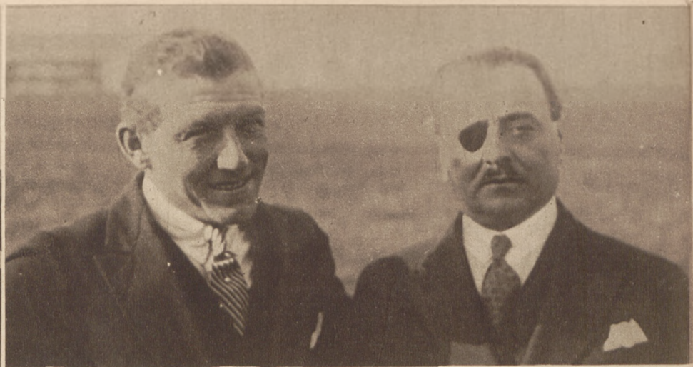
Dwa zdjęcia powyższe przedstawiają bohaterów francuskich, których los poruszył cały świat cywilizowany. Na lewo Nungesser, na prawo mechanik Coli. Na lewo aparat Nungessera z emblematami: trupia czaszka i trumna.