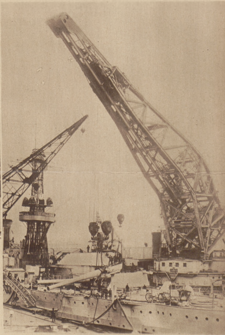
Obrazy z marynarki Stanów Zjednoczonych. U góry: Cała flotyła parowców holuje dredgnout „Colorado“, który ugrzązł na mieliźnie. Na prawo: Olbrzymi kran dźwigający 250 ton, zdejmujący z pancernika „Idaho“ armaty przestarzałego typu.