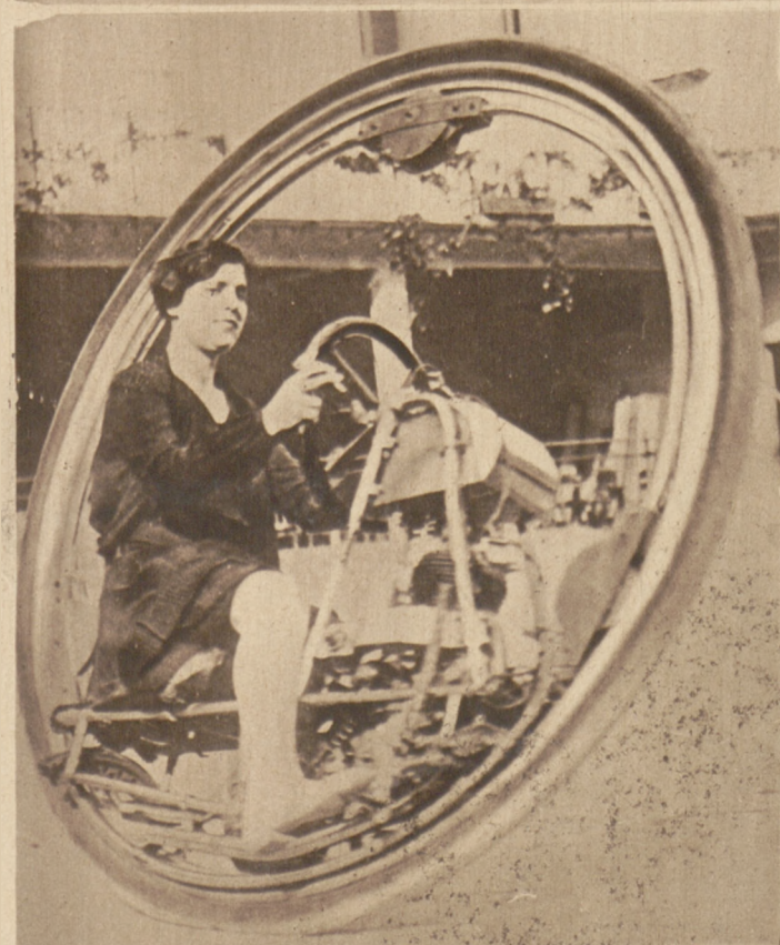
Wynaleziony przez Włocha Covetosa jednokołowy motor, wzbudził w Rzymie sensację.