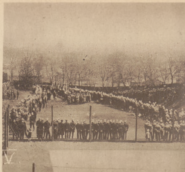
Zjazd straży pożarnych i poświęcenie sztandaru straży Towarzystwa „Solway“ w Grodźcu przy udziale 43 drużyn i 1500 strażaków.

1. Uroczysta msza św. na górze św. Doroty przed starym kościołkiem. 2. Defilada strażaków przed sztandarami, władzami i jubilatami. 3. Zarząd Okręgu będzińskiego Związku straży pożarnych. 4. Drużyna strażacka Tow. „Solway“ z nowo poświęconym sztandarem (na lewo), wraz z swoim zarządem i gośćmi. 5. Przemówienie wiceprezesa Związku na boisku.