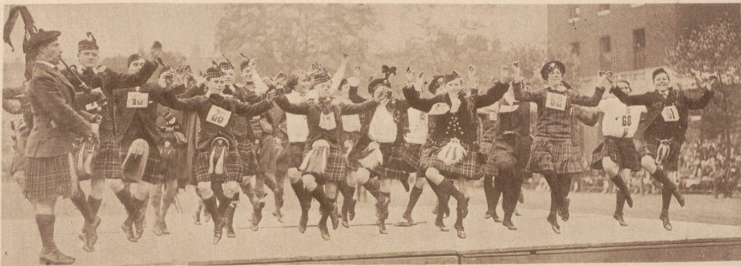
W Londynie odbywają się co roku popisy dzieci szkolnych w tańcach szkockich przy dźwiękach kobz. Na zdjęciu widzimy grupę dziewcząt i chłopców w malowniczych strojach szkockich górali podczas tańca.