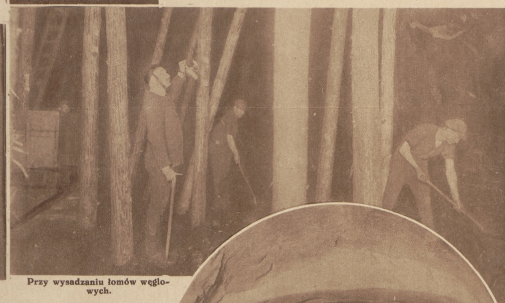
Przy wysadzaniu łomów węglowych.