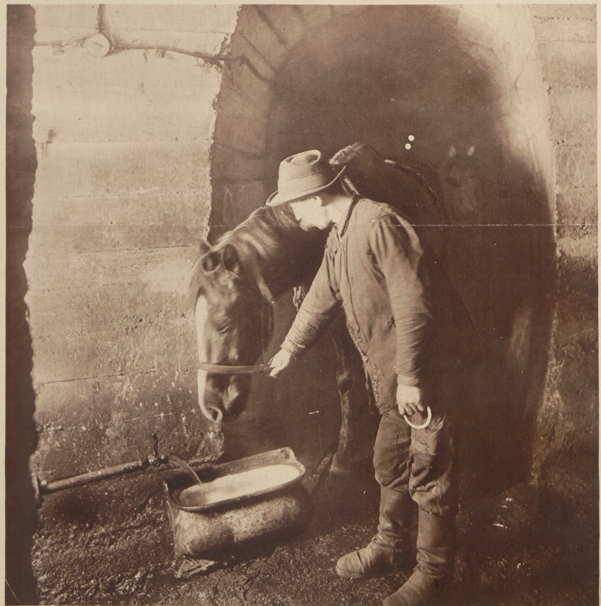
Pojenie konia w kopalni węgla (Zagłębie Dąbrowskie) pod ziemią na głębokości 300 m.