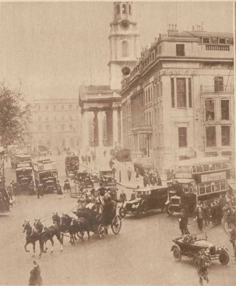
Członkowie słynnego z dzieła Dickensa klubu Pickwika w Londynie, jadą przez ulice miasta w dzień rocznicy klubu, staroświecką bryczką, która już 100 lat temu była w klubie w użyciu.