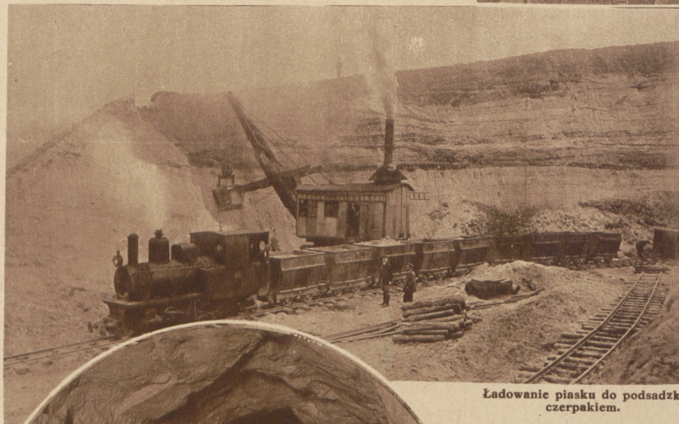
Ładowanie piasku do podsadzki czepakiem.