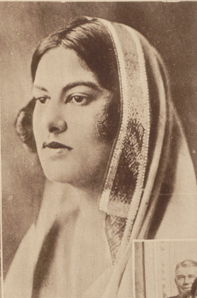
Portret Maharani Mandi, córki Maharadży z Kapurthala, która pierwszy raz w życiu pozwoliła się sfotografować.