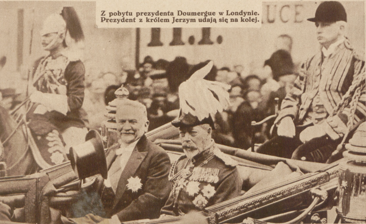
Z pobytu prezydenta Doumergue w Londynie. Prezydent z królem Jerzym udają się na kolej.