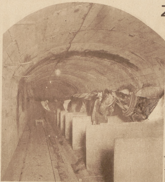
Stajnia na poziomie 300 m. pod ziemią.