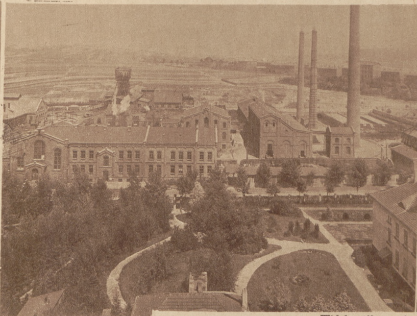
Widok ogólny na kopalnię Tow. Grodzieckiego.