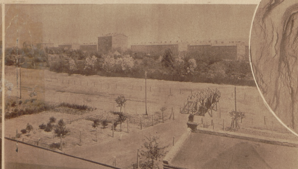
Widok na park robotniczy i część kolonii robotniczej.