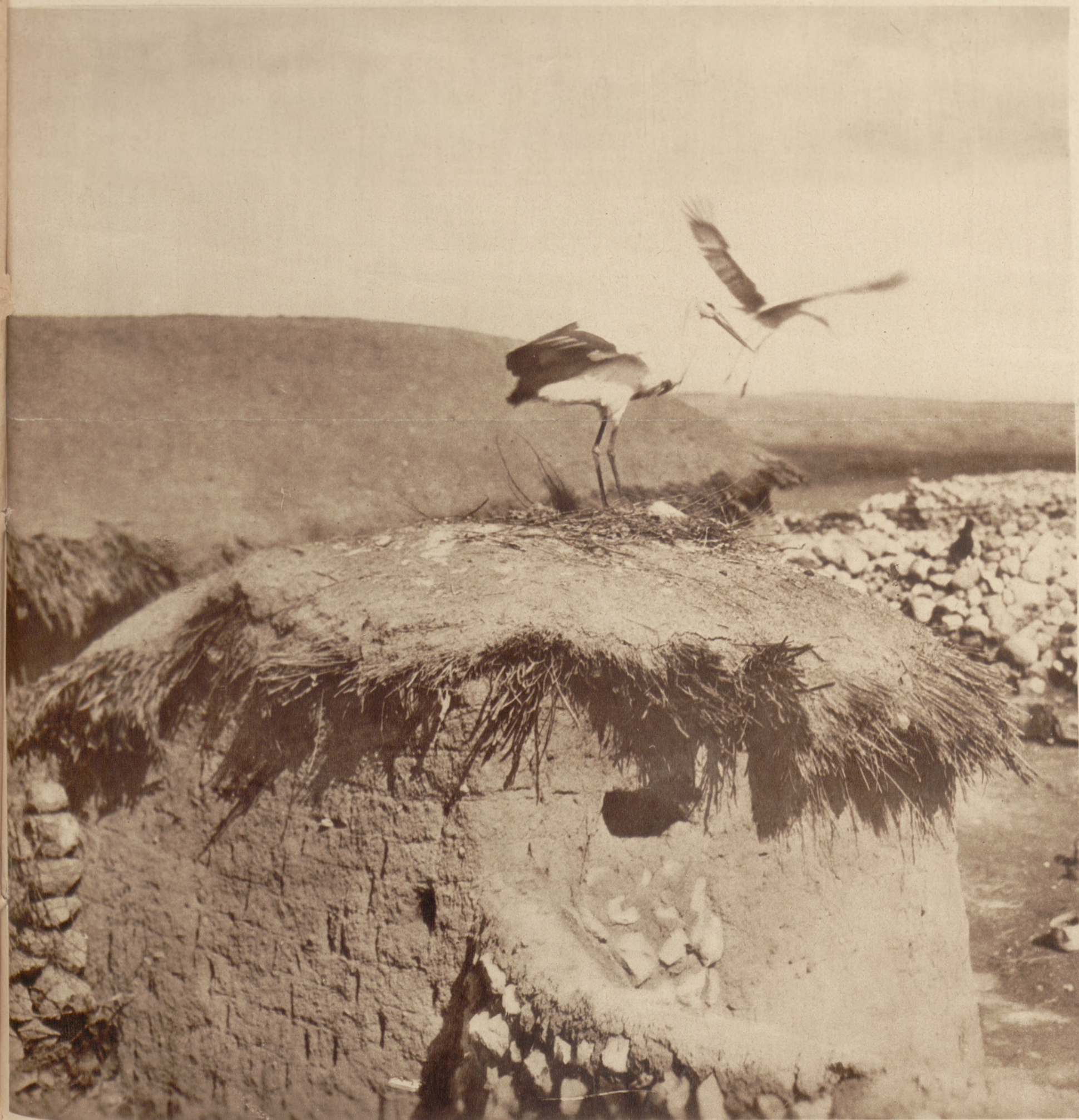
Bociany w Egipcie. Obrazek z Egiptu Górnego, z pobliza Asuanu, gdy nasze swojskie bociany porą wiosenną wybierają się w powrotną drogę do swej północnej ojczyzny.