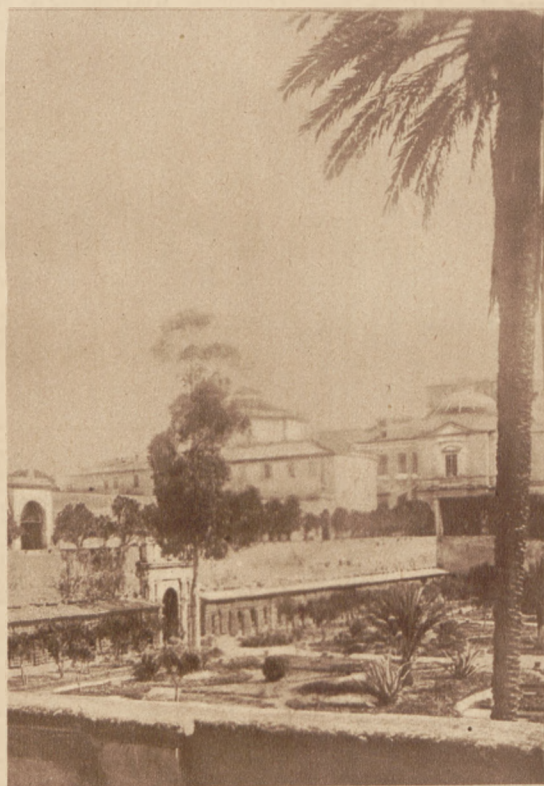
Z rezydencji papieskiej. Zdjęcia z Watykanu, będącego jedną z największych osobliwości Rzymu. Budowę rozpoczął w roku 1153 papież Eugeniusz III, dziś zabudowania liczą 11.000 ubikacyj. Na lewo malownicze zdjęcie pod światło wnętrza biblioteki. W środku ogród prywatny papieża. Na prawo: Wielka sala biblioteczna, którą wspaniałe freski i obrazy, czynią podobną do muzeum.