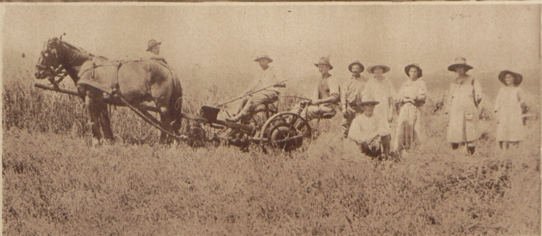
Koloniści — Polacy przy żniwach w Paranie (Brazylja).