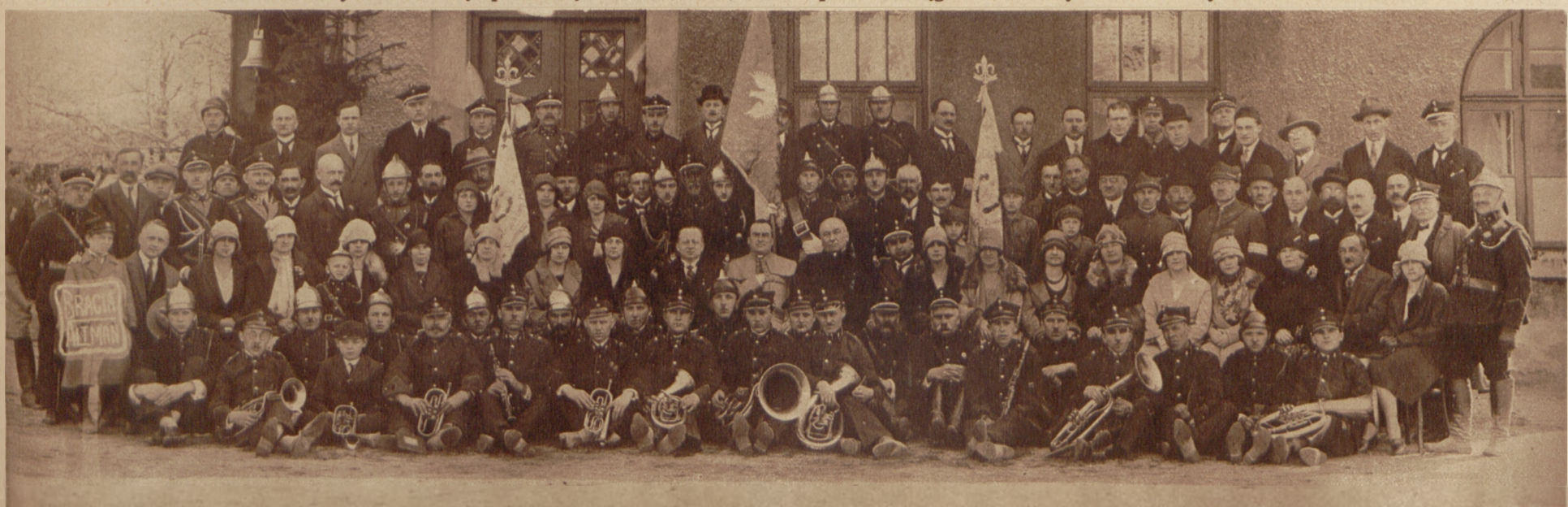
Poświęcenie sztandaru straży ogniowej „Sztrem” w Strzemieszycach.