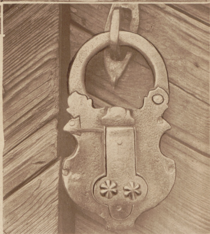
Na prawo: Oryginalnie rzeźbiona kłódka przy wejściu do kościoła we Włodowicach