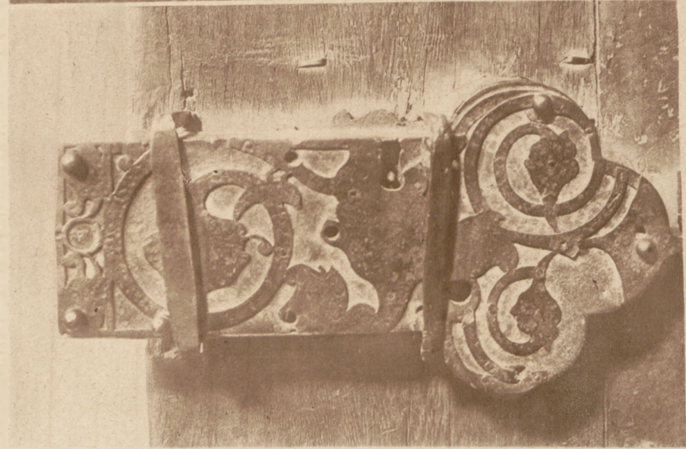
Na lewo: Zasuwa rzeźbiona z r. 1702 w kościele parafialnym w Włodowicach, powiat Zawierciański.