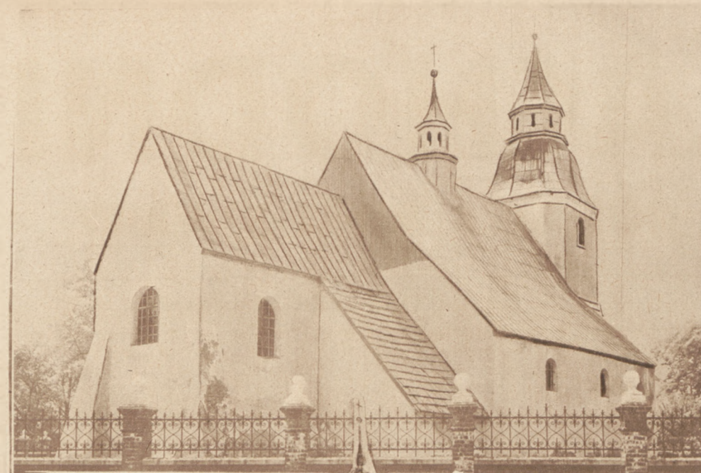
Kościół w Wojkowicach Kom., pow. Będziński.