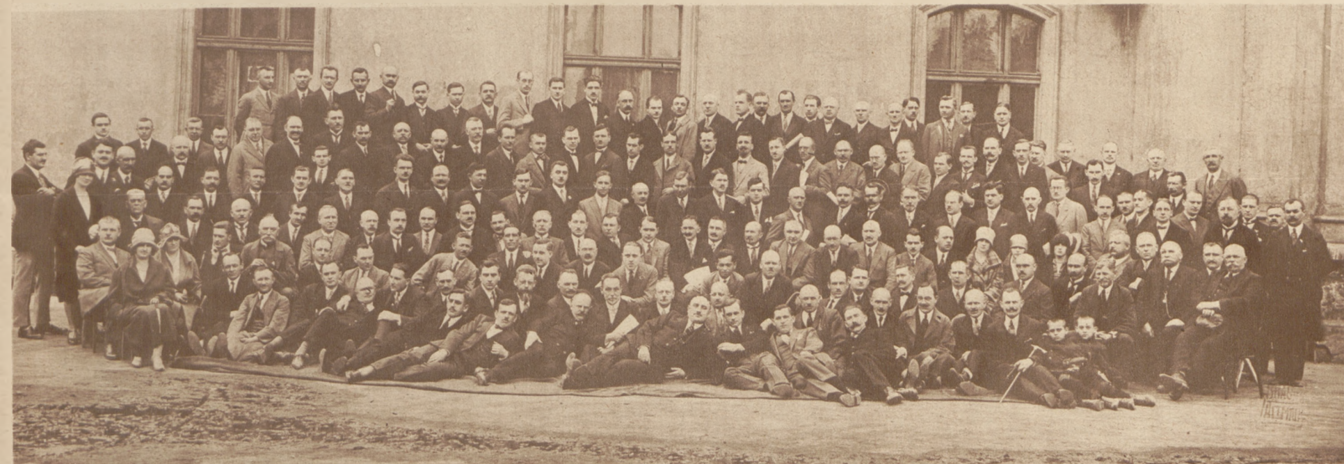
Uczestnicy walnego Zjazdu delegatów Pol. Związku zawodowego pracowników przemysłowych i handlowych, w Sosnowcu 22 maja b. r.