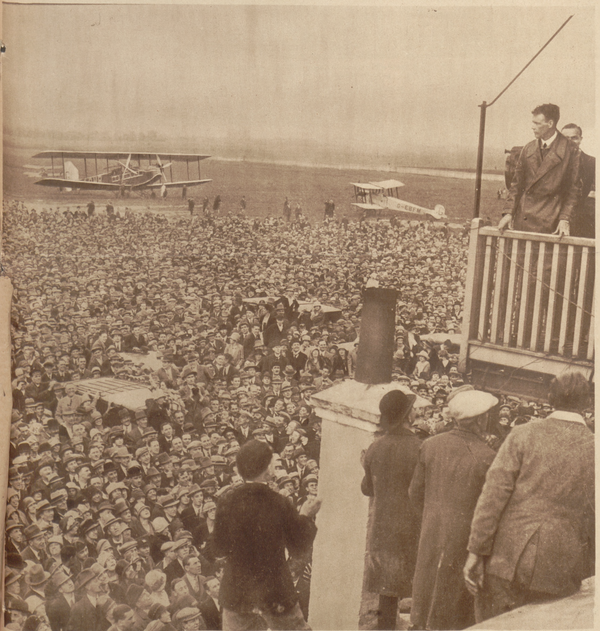
Przylot Lindbergha do Łoadynu. Lindbergh widoczny na mostku na prawo