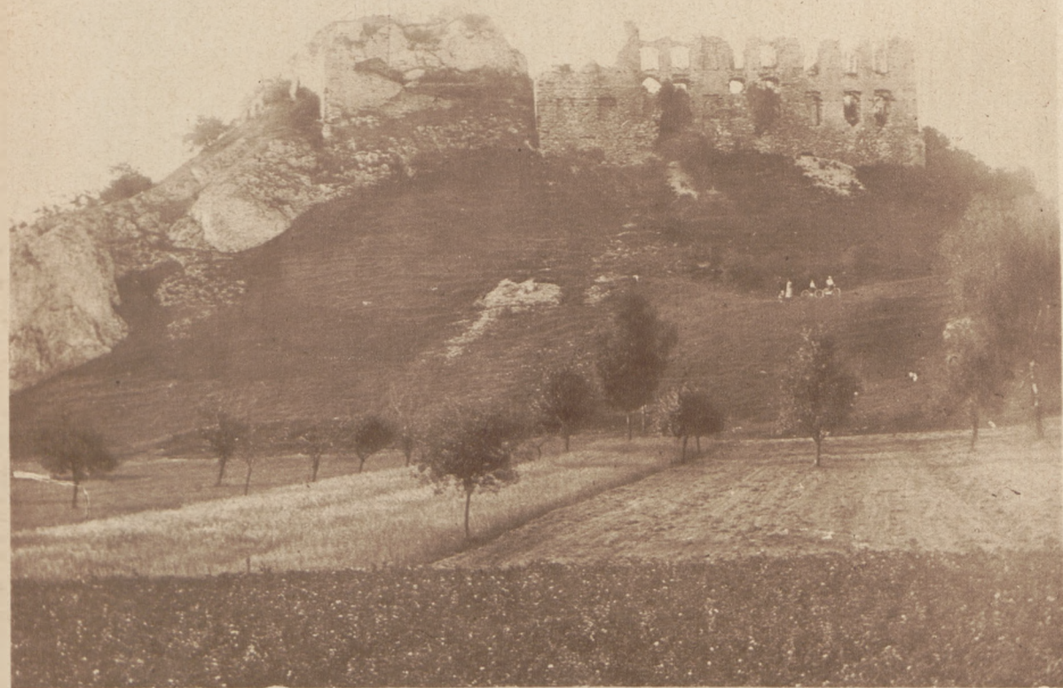
Ruiny zamku w Rabsztynie, pow. Olkusz, który oparł się w r. 1587 atakowi wojsk arcyks. Maksymiliana Habsburga.