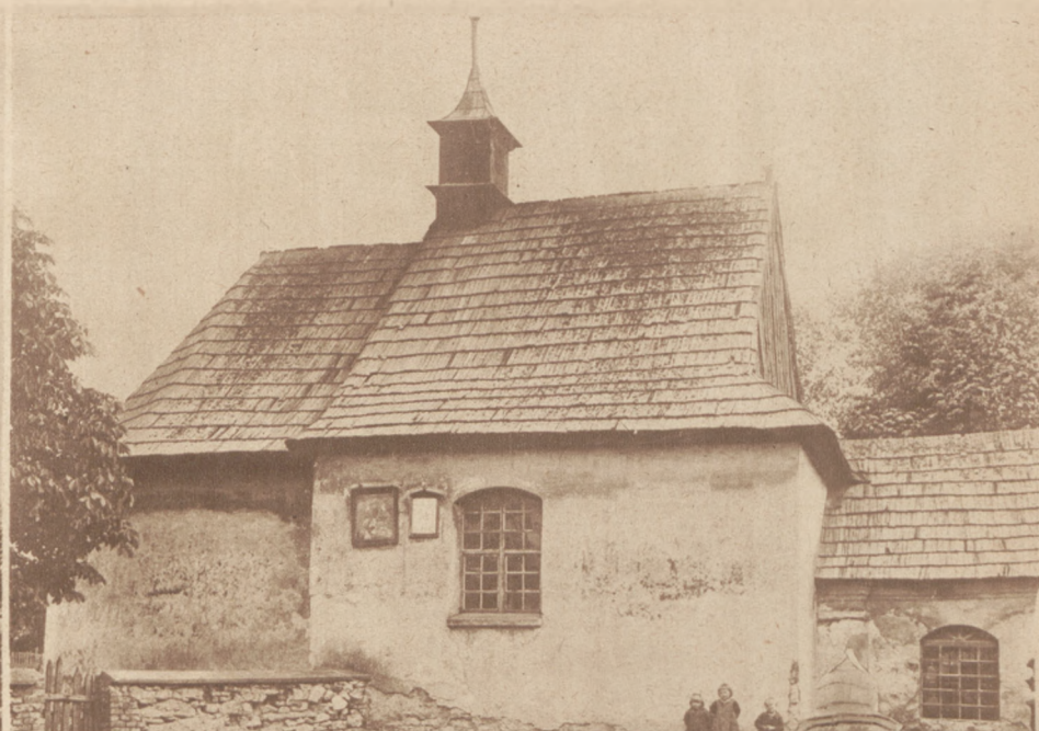
Kaplica w Wojkowicach Kom.