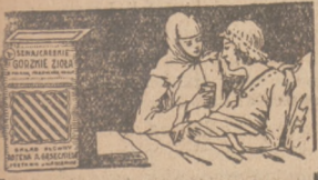
„KAZDIE O SVOJE ZOROWIE”