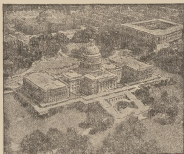
Opólny widok „Białego Domu” w Waszyngtonie

Jedno z piem paryżanek zadalo sobie trud i obliczyło procentowo, na jakie cele idą pieniądze, wpłacone przez Paryżan tytułem podatków miejskich. Okazuje się, że z każdej setki Franków podatku miejskiego 40 franków idzie na pensje dla urzędników miejskich. Reszta dalei się w sposób następujący: 24 franki na długi miasta, 16 na koszty opieki społecznej, 10 na opłacenie komornego instytucji miejskich, oraz utrzymanie materiam, 7 na roboty publiczne, 2 na koszty inkasa i buch-iterki podatków i wreszcie 1 frank na stypendia i subwencje.