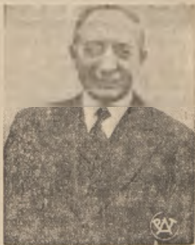
MIN. SPR. ZAGR. DELBOS.

ZA WOTUM ZAUFANIA, kierując się jedynie zasadą dyscypliny Frontu Ludowego. Komuniści dodali, że w obecnej chwili byli by właścicielami Rządu, w którym partia komunistyczna byłaby reprezentowana. Ten ostatni punkt wprowadził z równowagi premie