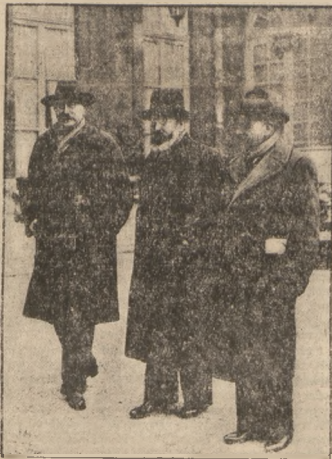
SOŁOWI PRZEDSTAWICIELE FRANCUSKIEJ PARTII SOCJALISTYCZNEJ BLUM, PAUL FAURE, DORMOY.

Blum wystosował do Chautemps następującą treść listu: „W ciągu ubiegłego dnia i nocy dołożyliśmy najwyższych wysiłków, aby zachować przy panu większości głosów Frontu Ludowego. Wypadki jednak, które zaszły na ostatnim posiedzeniu, zmusiły nas do złożenia na pańskie ręce naszej dymisji. Dziękujemy panu za zaufanie i przyjaźń, które nam pan zawsze okazywał.“