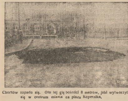
Chorzów zapada się. Oto tej góry bokiem 8 metrów, jaki wytworzył się w centrum miasta na placu Kopernika.

WOJNE PODJAZDOWA, która stwarza dla władz japońskich dużo kłopotu i trudności. (ATE).