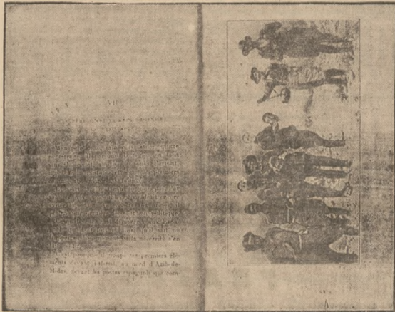
Reprodukcja fotografii z książki Abd-el-Krima Czytelnicy widzą, że to jest akurat to samo.