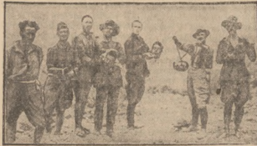
Reprodukcja fotografii z „Kroniki Polski i Świata”

cji”. Kłamstwo, oszczerstwo, uciekanie się — w chęci zbrzydzenia dokumentów. — Oto METODY MIEBLOTOMEM wszystkim co nie faszystwu.