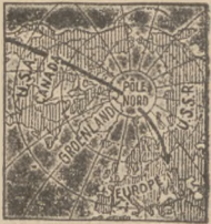
MAPA OKOLIC POBIEGUNOWYCH.

Kra lodowa, na której znajduje się ekspedycja „Biegun Północny”, porusza się z szybkością stosunkowo małą. Sowieckie kół naukowe przypuszczają, że gdy grupa Papanina znajdzie się mniej więcej na 74 stopnia szerokości północnej, będzie można dotrzeć do niej śmaczem lodów i wzięć ich na pomoc. Narazie jednak wyprawa sowiecka znajduje się na 81 stopnia szerokości północnej tak, że dotarcie do nich okrętem jest niemożliwe, a wysłanie samolotów byłoby bardzo ryzykowne, zwłaszcza, że pod biegiem panuje noc, a północne wybrzeże Grenlandii nie nadaje się do lądowania. Oczywiście, gdy wyprawa znajdzie się w bezpośrednim niebezpieczeństwie, lotnicy podjąłby akcję ratunkową bez względu na zagrożenie im niebezpieczeństwem. Dla zorientowania się w sytuacji udał się w kierunku Grenlandii słynny badacz polarny prof. Schmidt.