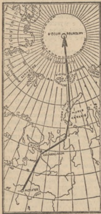
MAPA PRZELOTU EKSPEDYCJI DO BIEGUNA, Z BIEGUNA ŁÓDZKI ZANIOŚY WYPRAWĘ DO GRENLANDII.

Wyprawa odkryła prawo ruchu jakiemu podlegają masy lodu pod biegiem