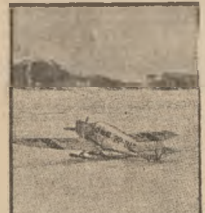
SAMOLOT SOWIECKI LĄDUJE NA JEDNEJ Z BAZ POBIEGUNOWYCH.

przyczyn ekspedycja zagrożona jest przez ruch lodów. Artykuły, opisujące życie „rozbitków” na krze lodowej ukazały się z okazji jubileuszu wyprawy. W tych dniach bowiem mi-