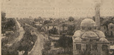
OGÓLNY WIDOK TIRANY, STOLICY ALBANI.

Wczoraj rano w pałacu królewskim w Tiranie, odbył się przedślubny ślub króla Zogu z hrabianką Apynoli. Ślub cywilny odbył się zgodnie z obowiązującymi w Albanii uślawami.