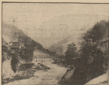
OBRAZEK Z ANDORRY.

Stawunkowo największym z nich jest Andorra, kraj górski, położony na południowym stoku wschodnich Pirenejów, o przestrzeni ponad 4.000 km kw. Na przestrzeni tej żyje około 6 tys. mieszkańców, należących do secesji katolickiego. Cechuje ich podobnie, jak ich bracia spod Barcelony, fanatyczne umiłowanie wolności. Dzięki gór, których zbocza pokryte są wspaniałymi lasami i rozległymi pastwiskami, dobiega tuż do granic królestwa i wspaniałe piekno. Andorra należy do krajów, w których życie dobiega w bogactwie naturalne. Posa hodowli i wyrobem lasów, stanowiących główne źródło utrzymania mieszkańców, górale andorrescy żyją z eksploatacji rudy żelaznej, a nawet w ostatnich czasie zaczęto eksploatować węgla kamiennego, za to dość bogate w srebrne pokłady błękitu obwieszone. Wspaniałe, niekiedy te w swej pierwotnej dzikości góry Andory stać się mogą miejscem wypoczynkowym dla ludzi zmęczonych nerwowo, pragnących w obcowaniu z pierwotnością przyrody powrócić do stanu równowagi psychicznej. Liczne, niewysokane dotychczas gorące źródła wód mineralnych zawierają cenny pierwiastki lecznicze. Andorra, to kraj pełen legendarnego troku. W podaniach ludowych tej okolicy dotrwały do naszych czasów echa dalekich, o dziesiątki wieków odległych, wydarzeń dzie-