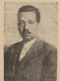
KS. FR. LICHTENSTEIN, NOWY SUWEREN KSIĘSTWA LICHTENSTEIN.

W Księstwie Lichtenstein, położonym w górach alpejskich u pogranicza Austrii i Szwajcarii, zajmującym obszar 159 km. kw. z 11.500 mieszkańcami, obraduje najmniej liczny sejm na świecie, liczący 15 posłów, a czego 12 wyiera ludność, zaś 3 miejsce książ-