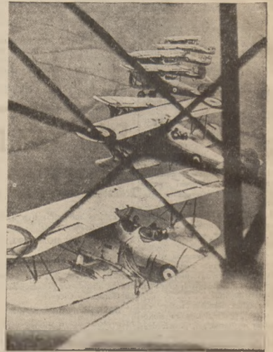
ESKADRA SAMOLOTÓW BOMBOWYCH.

niezgodnej z morzem floty nie- przyjacielskiej, samoloty wywi- adkowe ułatwiają flocie macie- rzyszej prowadzenie właściwej tak- tyki. Ponieważ ciężkie działa niosą dalej jak sięga wzrok z o- krętowej wieży obserwacyjnej, więc samoloty, dając informacje radiowe kierownikom ognia arty- leryjskiego, umożliwiają w ten sposób rozpoczęcie bitwy mors- kiej na wielką odległość. Jest zaś utrwalone przekonanie, że kto pierwszy daje salwę, choćby na- wet salwa nie była celna, przez jej moralne działanie na przeciwni- ka zyskuje połowę szans zwycię- stwa. Ale z chwilą, kiedy się roz- poczyna bitwa między wielkimi si- łami bojowymi morskimi, zjawia- ją się znaczne siły powietrzne do tychczas trzymane w rezerwie. Są to samoloty wzięte przez spe- cjalny okręt, który, nie posiadając dostatecznie grubego pance- rza, towarzyszy okrętom bojo- wym w takiej odległości, że po- zostaje zawsze poza obrębem o- gnia artyleryjskiego. Samoloty,