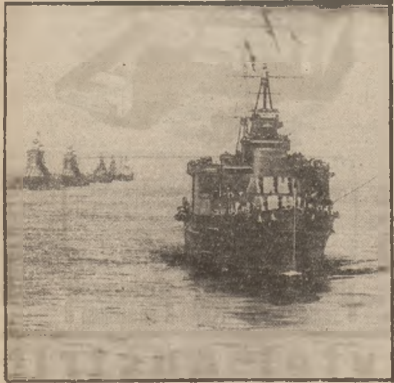
GROZNA ESKEDRA KRAŻOWNIKÓW.

W czasie wojny, jednym z głównych celów działań wojennych na morzu jest zabezpieczenie własnych i niszczenie nieprzyjacielskich transportów żywności, materiałów wojennych i wojska. Jednym z radykalnych sposobów zapobiegania nad drogami morskimi były niegdyś wydane walne bitwy i zniszczenie, albo liczebne osłabienie floty nieprzyjaciela w takiej mierze, że nieprzyjaciela nie mogli się więcej pokusić o atakowanie transportów morskich. Pod czas wojny światowej bitwa pod Skagerrakiem miała do pewnego stopnia takie właśnie znaczenie. Ale wówczas istniały już lotnictwo podwodne, których nie można było zniszczyć przez wydanie walnej bitwy. Stąd też po bitwie pod Skagerrakiem, w której niemiecka flota nawodna odniosła wielkie sukcesy i ograniczyła się potem do obrony wybrzeża, rolę niszczącej w transportach wojennych alian- towych wzięły na siebie lotnictwo podwodne. Dział, oprócz łodzi podwodnych, dokonywały tego samoloty. Udział ich nada aliamom na transporty zupełnie nowe, bezporównania groźniejsze oblicze. Jeżeli bowiem tylko podwodna flota atakowała porty na pełnym morzu i okręt transportowy, który dostał się do portu, może za- pomnieć o niebezpieczeństwie sił podwodnych, to samoloty jest wrogiem atakującym przede wszystkim wtedy, kiedy okręty transportowe zjawiają do portu. Dla es-