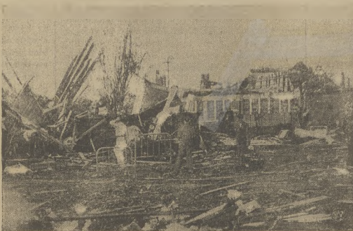
Na zdjęciu fragment zniszczenia miasta Clyde w stanie Texas, spowodowanego rozszalałym tornadem, podczas którego szereg osób poniosło śmierć od zasypania guzami zburzonych domów.