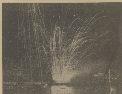
Tradycyjne wianki na Wiśle, w noc świętojańska, przy wspólnych relikwacjach świętynich.