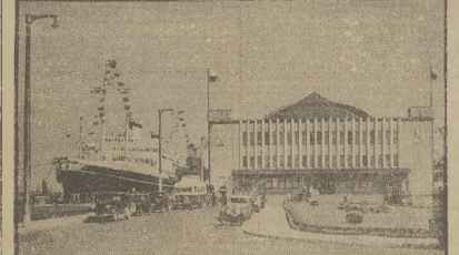
DWURZEC MORSKI. Moment przybycia do portu mis. Batorego z Ameryki do Polski.