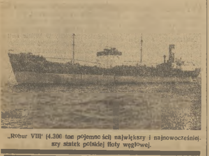
„Robur VIII” (4.300 ton pojemności) największy i najnowocześniejszy statek polskiej floty węglowej.