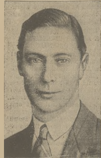
KRÓL JERZY VI

Wzrusnik prawnymytery, w Krakowie z adnoseniem miesięcznie zł. 2.50, na prowincji miesięcznie zł. 2.50, zagranicą zł. 6.00. Za zmianą adresu 50 gr. Ceny ogłoszeń: Za wiersz wysokości 1 milimetr w teście gr. 50, zwyższe gr. 40, nekrologi do 60 mm. gr. 20, powyżej 60 mm. gr. 50, drobne za wiersz 20 gr. Poszukiwanie i zaufarowanie pracy bezpłatnie. Ogłoszenia tabeleacyjne o 60 proc. drożej. Układ ogłoszeń tekstowych i zwyższonej 6-to szapiltovej. Za treść ogłoszeń Redakcja nie odpowiada.