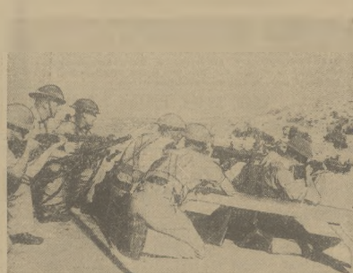
ANGIELSKI POSTERUNEK WOJSKOWY Z KARABINAMI MASZYNOWYMI NA STANOWISKU W T. ZW. TRÓJKĄCE TERRORU.

Wciągu 2 dni zabito w Palestynie 13 Żydów