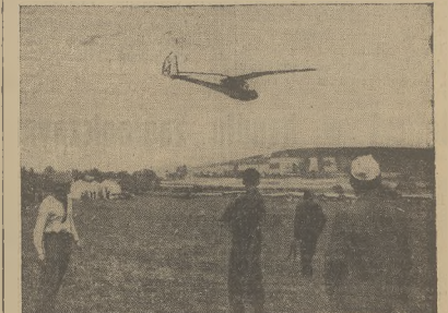
W Masłowie pod Kielcami odbywają się VI krajowe zawody szybowcowe. Reprodukcyjne zdjęcie, przedstawiające start szybowca na wyciecznym z latniska w Masłowie.