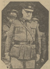
GEN. MIAŁ NACZELNY WÓDZ ARMII REPUBLIKANSKIEJ.

Jak już podaliśmy, przed kilku dniami armia republikańska rozpoczęła ofensywę na odcinku Albarracín. Ofensywa ta rozwija się pomyślnie według przewidzianego planu. Trzy oddziały republikańskie działające oddzielnie posunęły się naprzód w kierunku wzgórz La Sierra i nawiązały łączność między sobą. Wzdłuż całej linii obronnej laszystów z obu stron wąwozu Guadalquivir, wojska republikańskie zdobyły ufortyfikowane podług ostatnich wymagań techniki pozycje górskie laszystów, które stanowiły dość poważną przeszkodę. Po zdobyciu nieprzyjacielskich pozycji na stokach Albarracín, wojska