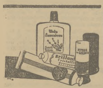
Mydło i krem do golenia. — Woda ławendowa.