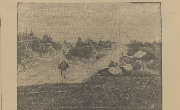
Muzeum Historii Naturalnej w Chicago założyło ostatnio nowy dział muzealny, poświęcony życiu Bolesława. W dziale tym został zamieszczony duży obraz, zatytułowany „Bolesława w polskiej wsi”. Obraz ten reproduujemy.