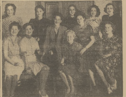
Na zdjęciu pmiowane piękności szeregów krajów europejskich, zgromadzone w Kopenhadze, w oczekiwaniu na wybór „Miss Europy”. Od lewej: miss Węgry, miss Belgia, miss Rosja, miss Norwegia, miss Francja, miss Anglia. Stoją od lewej: miss Finlandia, miss Grecja, miss Szwajcaria i miss Jugosławia.