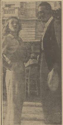
ARTYŃCY FILMOWI NA WYWCZASACH Na zdjęciu Marlena Dietrich i Maurice Chevalier podczas tegorocznych wyścigów w Cannes.