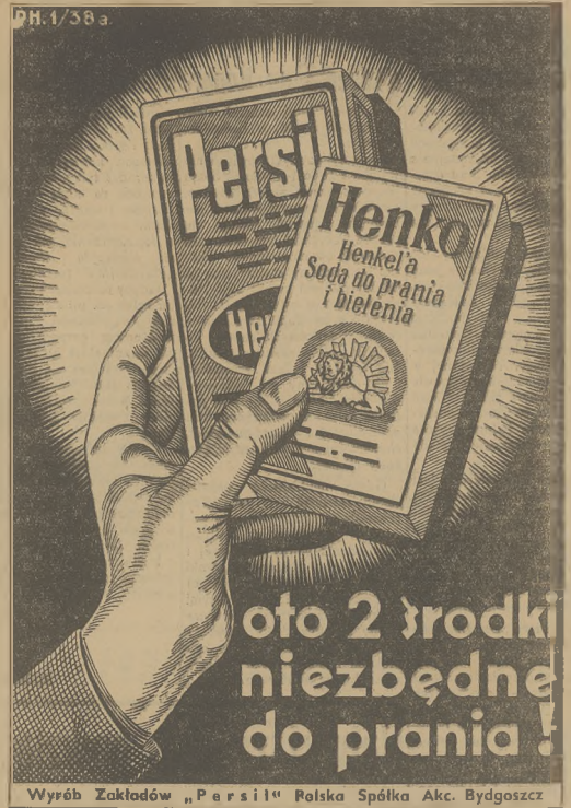
Wyrób Zakładów „Persil” Polska Spółka Akc. Bydgoszcz