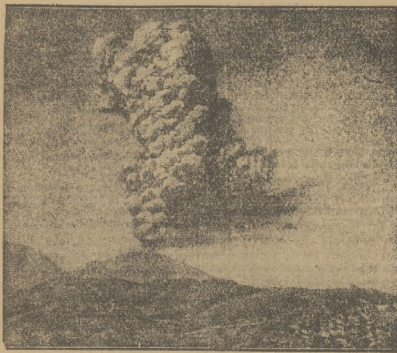
Wulkan Krakatau wyprzedził się znowu światu niedawnym wybuchem. Dzieje jego i wyspy też nazywają się wysoce ciekawe.

Gdy 26 sierpnia 1883 r. wybuch wulkanu Krakatau rozszedł połowę wyspy, resztę pokryła warstwa popiołu grubości 7 metrów i zdusiła wszelkie objawy życia. Nie uratował się za ten czas, owad czy ptak. I gdy po katastrofie, która w całym świecie wywołała wstrząsy, burze i zakłócenia atmosferyczne, po raz pierwszy wstąpiła na wyspę noga ludzka, nie było na niej ani roślinności, ani żadnej istoty. Obszar wyspy wynoszący dawniej 33 km kw. zmniejszył się do 10 km kw.