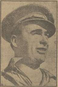
GEN. ENRIQUE LISTER

Faszyści stracili już 50.000 żołnierzy na froncie Ebro