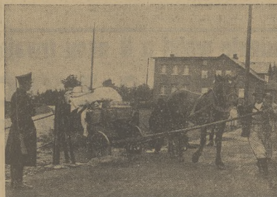
DALSZA UCIECZKA HITLEROWCÓW Z CZESKOSŁOWACJI

władz wartowniczych muszą być nadawane w kopertach otwartych. Przesyłanie fotografii w listach jest wzbronione. Równocześnie ukazano się rozporządzenie nakazujące wysłanie specjalnego pozwolenia władz bezpieczeństwa na odbiór zebranych odbiorczych, a nawet i zw. zebran o charakterze prywatnym. Jednocześnie zarządek krajowy czeskiego wydał zarządek noszenia mundurów przez członków wszystkich partii politycznych. Zakaz noszenia krawału czeskiego ma być rozciągnięty na cały obszar republiki.