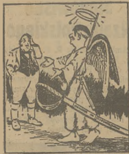
HITLER JAKO ANIOŁ POKOJU.

Dzienniki londyńskie stwierdzają zgodnie, że jest publiczną tajemnicą, że propozycje angielsko-francuskie w sprawie Czeskosłowacji przewidują ustąpienie Niemcom okręgów, zamieszkałych w znacznej większości przez Niemców,