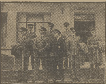
DELEGACJA LOTNICZA ANGLIJSKA, KTÓRA BAWIŁA WĘGRAMAMI NARADZAJĄC SIĘ Z TAMTĘJSZYM KIEROWNICTWEM SIŁ POWIĘTZNYCH.