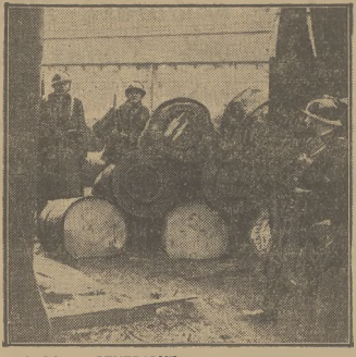
W DNIU STRAJKU GENERALNEGO WOJSKO OBRONAŁO WSZYŚTKIE FABRYKI WE FRANCJI.

wać ryb dla garnizonu włoskiego. Na tym tle dochodziło do wielu sejsji, w co wkrótce miały wia- dze miejscowe, wydając kupcom i rybakom nakaz obsługiwania wszystkich zgłaszających się klientów bez względu na ich narodowość.