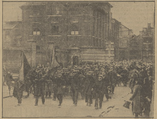
DEMONSTRACJA ROBOTNIKÓW W PRZEDDZIEN STRAJKU W WALENCIENNES.