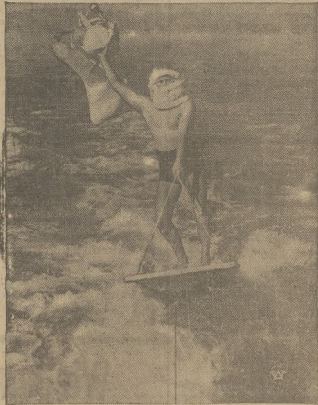
Wesoły Kalifornijczyk, udający się symbolicznie św. Mikołaja, w stroju kąpielowym, rozdziela podarki przedświąteczne, płynące na trasie.