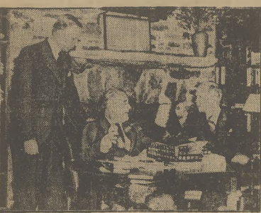
Ambasadorzy amerykańscy w Berlinie i Rzymie składają Prezydentowi Rooseveltowi bezpartyjny raport o sytuacji w „Trzeciej” Rzeszy i faszystowskich Włoszech.