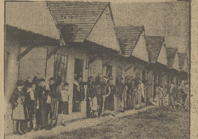
w Anglii w Liverpoolu przy zamknięciu szkoły dla 6000 dzieci żydowskich wywiezanych z Niemiec. Dzieci te zostaną wysłane do Dominionów i kolonii angielskich.