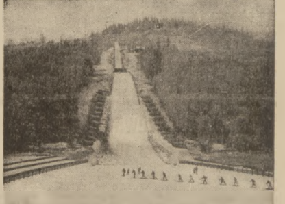
Na zdjęciu — rzad oka na skoczni są narciarzami na Krowli, na której odbędą się Międzynarodowe Mistrzostwa Narciarskie.