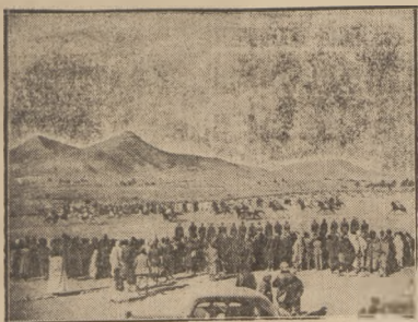
DALADIER WZIEDZA FRANCUSKIE LINIE FORTYFIKACYJNE NA PUSTYNI.